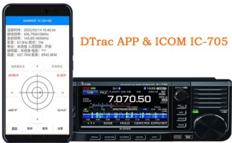
DTrac APP & ICOM IC-705